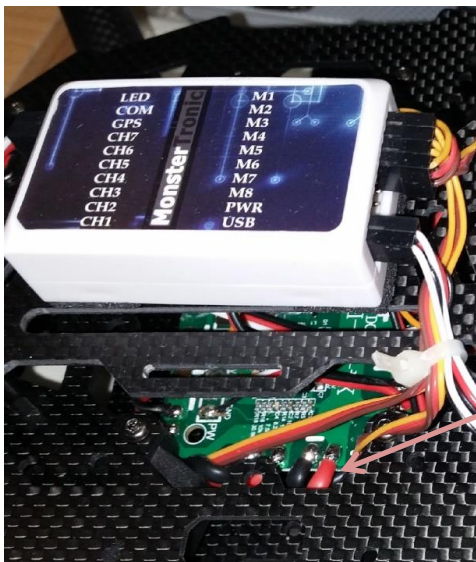
Anschluss der Regler